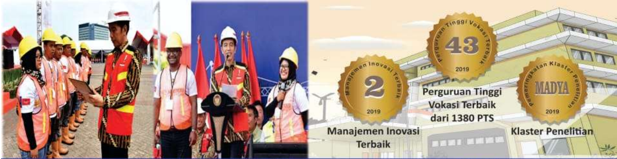
Penyerahan Sertifikasi kepada Alumni Alat Berat oleh Bapak Presiden Ir. H. Joko Widodo